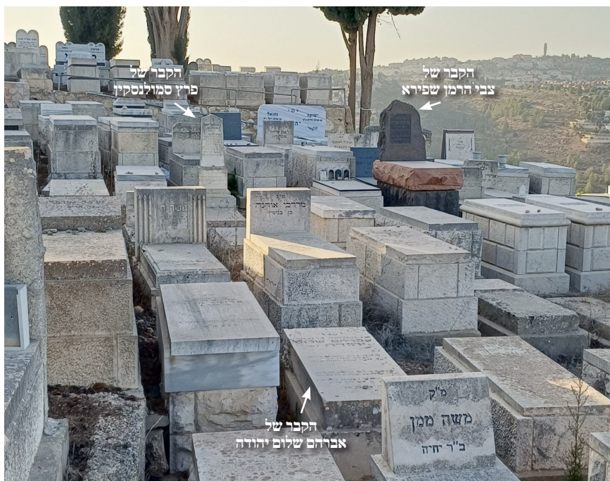
קבריהם של פרץ סמולנסקין, צבי הרמן שפירא ואברהם שלום יהודה בחלקת העדה הספרדית המאוחדת.